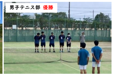
男子テニス部 優勝