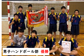
男子ハンドボール部 優勝