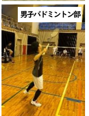
男子バドミントン部