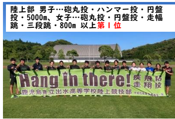
陸上部 男子…砲丸投・ハンマー投・円盤投・5000m、女子…砲丸投・円盤投・走幅跳・三段跳・800m 以上第1位