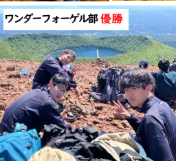
ワンダーフォーゲル部 優勝