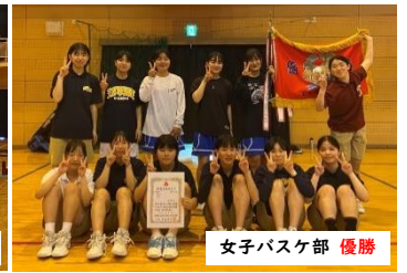
女子バスケ部 優勝