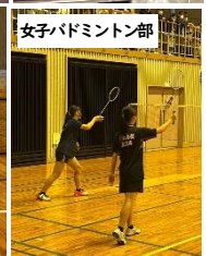
女子バドミントン部