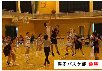
男子バスケ部 優勝